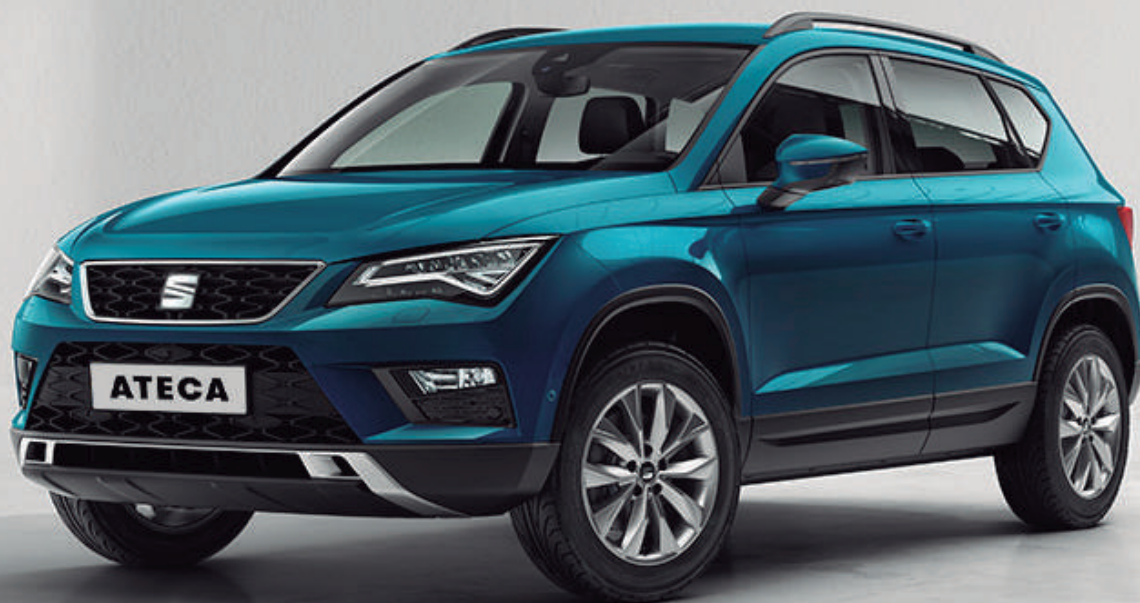
Imagen de referencia. El equipamiento hace parte de la ambientación fotográfica. No incluye accesorios dado que ni el importador ni su red de concesionarios los importan y/o comercializan.