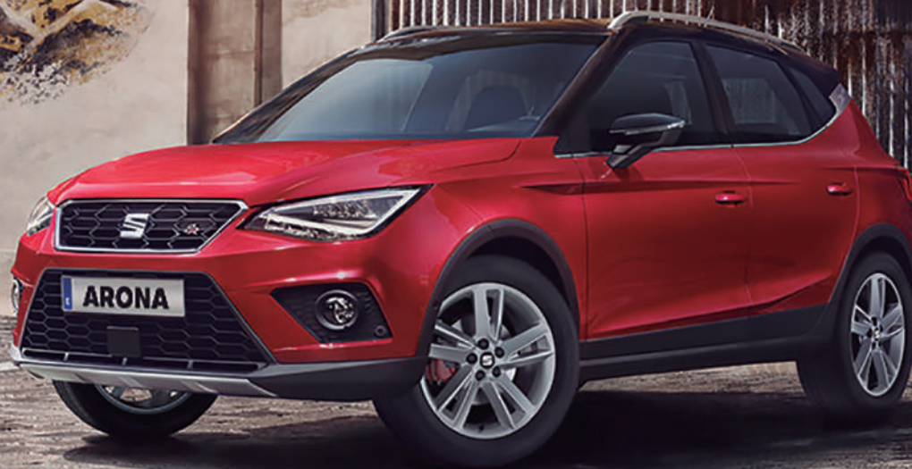
Imagen de referencia. El equipamiento hace parte de la ambientación fotográfica. No incluye accesorios dado que ni el importador ni su red de concesionarios los importan y/o comercializan.